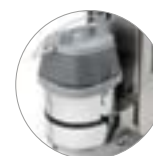
Saugmotor mit hoher Leistung (V)