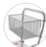
Wagen mit Korbhalter für Zubehör