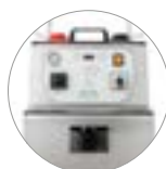
Bedienpult mit Display und Manometer