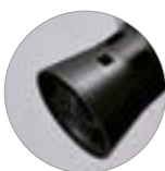
Korbfilterhalterung mit Schwimmer