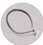
Antistatik-Kit (IK Ausführung)