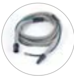
Schlauchleitung für Druckluftgerät