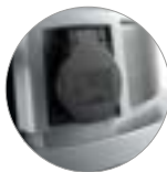
Stromanschluss für Elektrovorrichtung