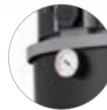
Manometer (Ausführungen M)