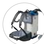
Zubehörhalterungen am Rahmengestell