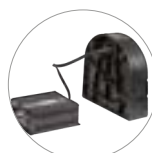
Ladegeräte und akkus