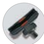
Trockenbodendüse RD 285