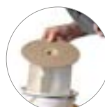
Vliesfilterbeutel und Textilfilter