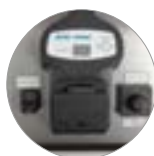
Intuitive Bedienelemente und Display