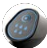
"Warm Wasser" Funktion