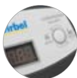
Turbo Power- Funktion