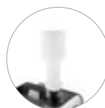
Praktische und schnelle Befüllung