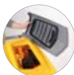
Sammelfilter für große Unreinheiten + Schutzfilter des Saugmotors