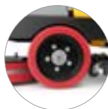
Antrieb an den Hinterrädern (Ausführungen RD)