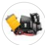
Gute Zugänglichkeit aller Komponenten