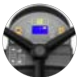
Praktische und intuitive Bedienpult mit Display