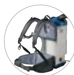
Zubehörhalterungen am Rahmengestell