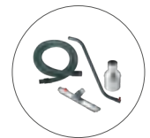
Große Auswahl an antistatischen Zubehör