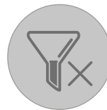
Steuerung des Filterverstopfungsniveau