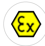
Atex Z22 II 3D Zertifizierung