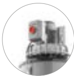
Macht und Geräuschlosigkeit