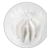
Taschenfilter aus antistatischem Polyester