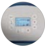
Bedienfeld mit display