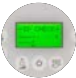
Zugangspasswort, Praktikabilität und Sicherheit