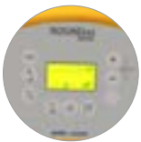
Bedienfeld mit display