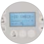
Zugangspasswort, Praktikabilität und Sicherheit