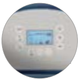
Bedienfeld mit display