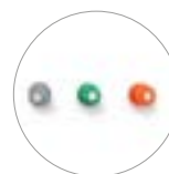
Große Auswahl an Düsen