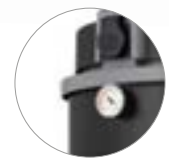
Manometer (Ausführungen M)