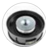
Hocheffizientem Kartuschenfilter (KLASSE M)