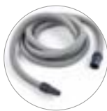
Schlauch für Elektrovorrichtung