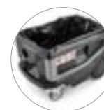
Beutel aus PE (opt.)