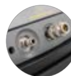
Kit COMBI (opt.)