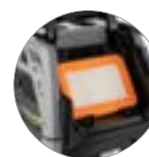
Flachfilter aus PTFE