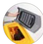
Sammelfilter für große Unreinheiten + Schutzfilter des Saugmotors