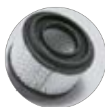
HEPA Kartuschenfilter (opt)